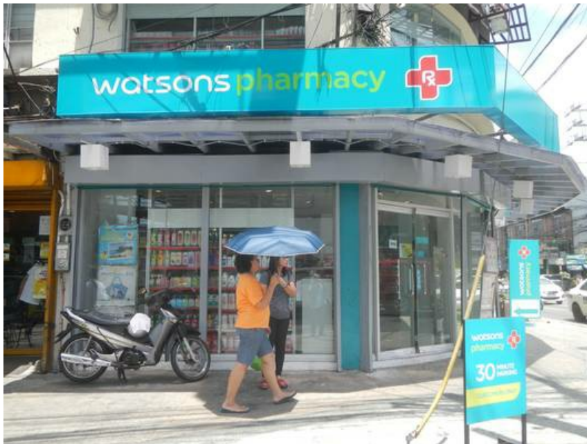
1248Watsons Pharmacy

Fit for travel » sowie das philippinische Gesundheitsministerium Department of Health (DOH) » geben Auskunft darüber, wie Sie gesund bleiben und sich fit halten und welche entsprechenden Vorsichtsmaßnahmen sinnvoll sind und/oder unbedingt getroffen werden sollten. Zusätzliche Informationen vermittelt die Weltgesundheitsorganisation World Health Organization (WHO) ».